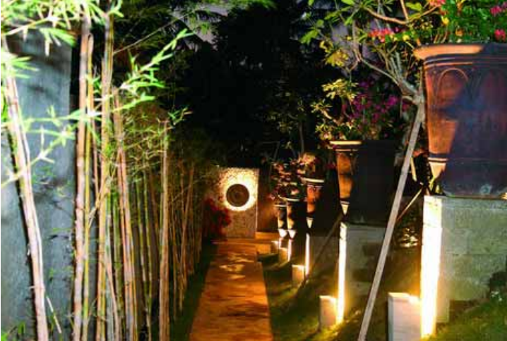
Photo 1: prosesi jalur – penghubung simpul pembukaan dan bangunan hunian utama