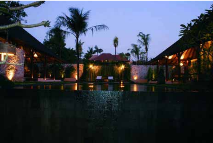
Photo 2: dua simpul bangunan Wantilan dan ruang terbuka dalam satu sumbu