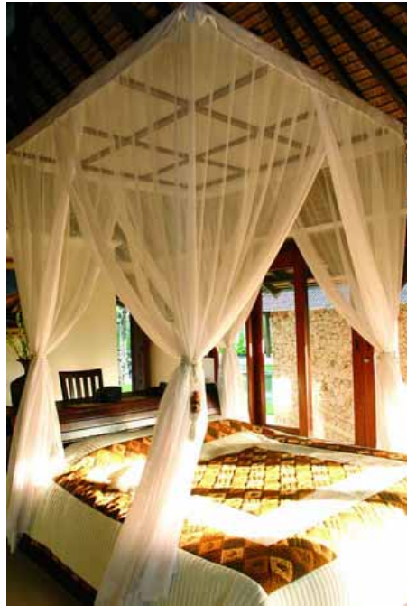
Photo 5: bangunan tempat tidur utama (Foto: Busur) Photo 6: kamar tidur utama (Foto: Busur)

Terlepas dari keunikannya, ada beberapa pertanyaan rancang bangun yang tergugah ketika menikmati ruang di rumah peristirahatan ini. Ketiadaan fasilitas umum mendasar semacam ruang toilet bersama, pancuran kolam renang, ataupun penghubung bebas hujan antara sayap bangunan menggelitik rasa ragu apakah rumah digunakan secara