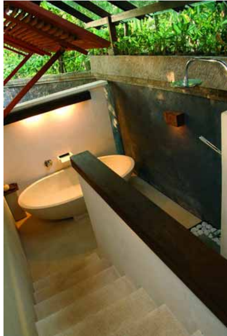
Photo 4: kamar-mandi utama, lantai teraso menjadi dasar kanvas dengan goresan material kayu